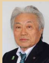
国際ロータリー第2500地区

九本（第6分区）：その地方に立脚した奉仕活動をすべきであって、大きな予算に裏付けされた事業ばかりが立派であるとの考え方でなく、そのクラブそのクラブの体質にあった事業を組むべきであると思います。